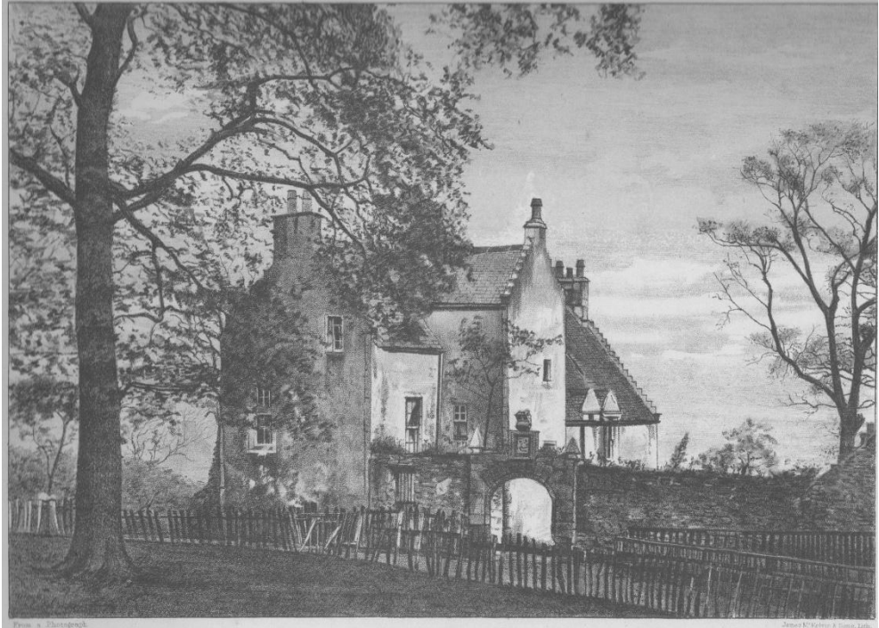
The ancient House of Cartsburn 4 (feudal barony)

Questa sopravvivenza giuridica rende la baronia feudale scozzese un caso unico. Essa non conferisce privilegi politici, ma mantiene una realtà giuridica residuale, soprattutto in ambito araldico.